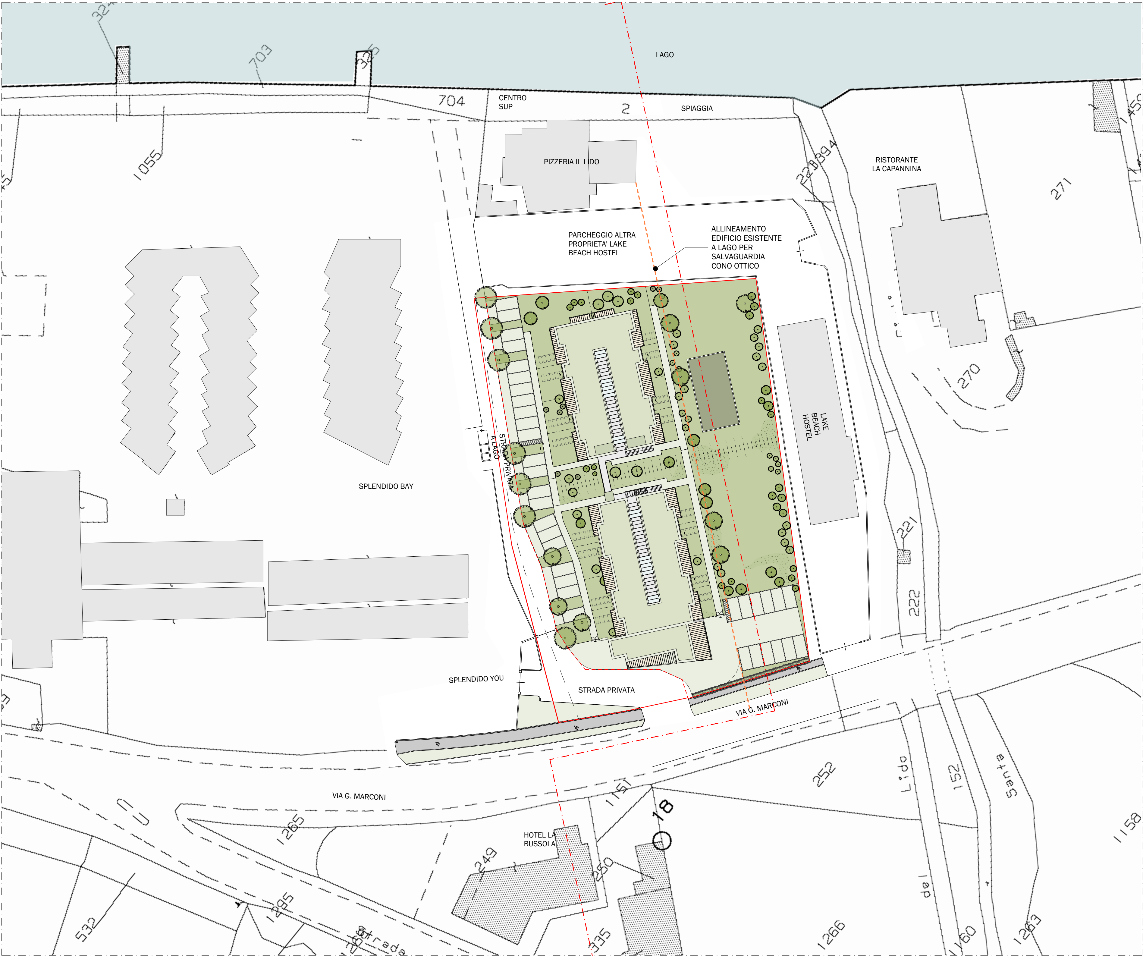
1. PLANIMETRIA D'INSIEME 1:500