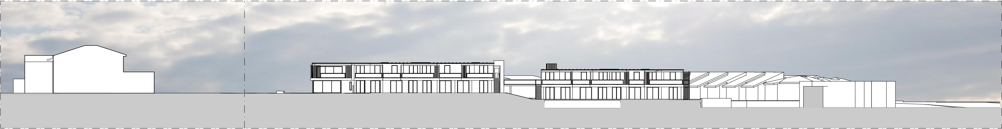
A SEZIONE TERRITORIALE A-A 1:500

Dottore Forestale e Ambientale Dott. Adriano Prandelli