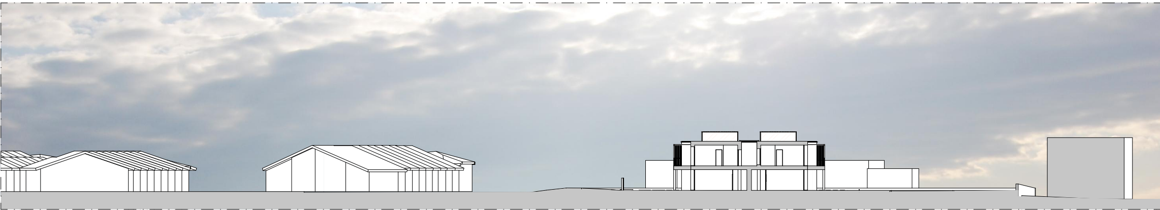
B SEZIONE TERRITORIALE B-B 1:500